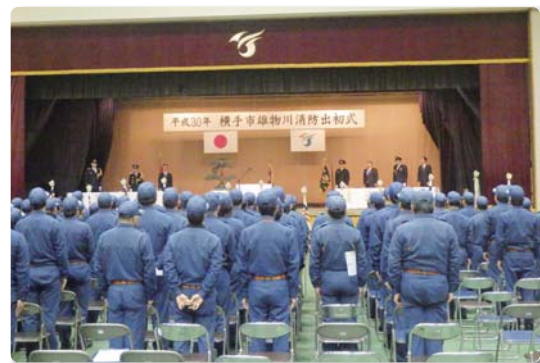
横手市雄物川消防団