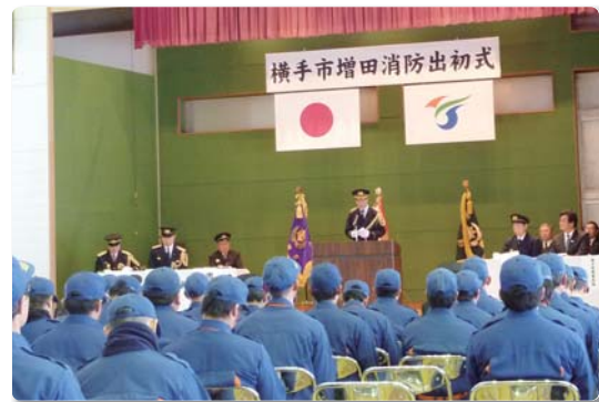
横手市増田消防団