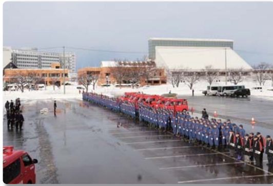
横手市横手消防団