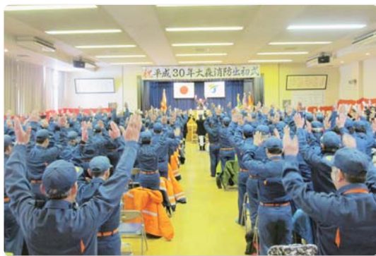
横手市大森消防団