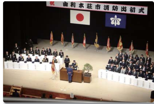
由利本荘市消防団