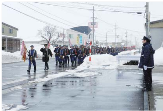
横手市平鹿消防団