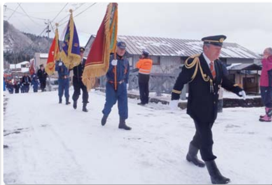
上小阿仁村消防団